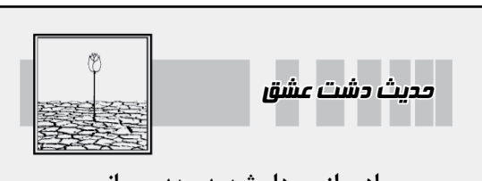
حدیث دشت عشق

صفحه ۵ یکشنبه ۷ تیر ۱۴۰۵ ۱۳ محرم ۱۴۴۸ – شماره ۲۴۱۷۳