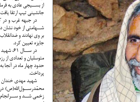
شهید حیدر تقوی‌فر