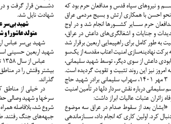
شهید سیدهادی علوی