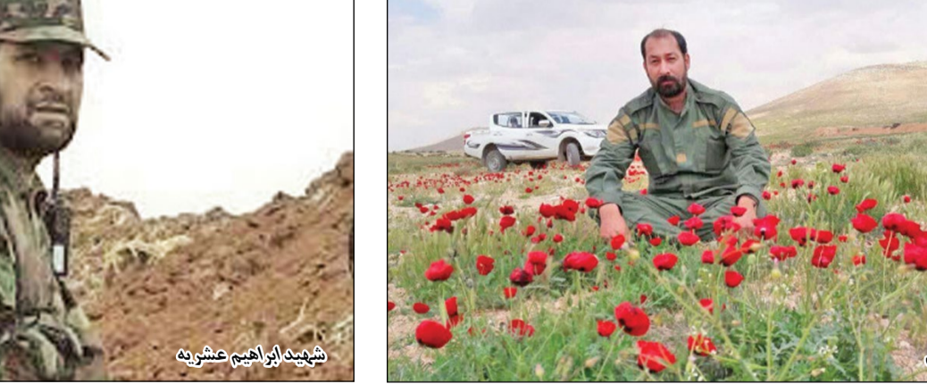
شهید سیدهادی علوی