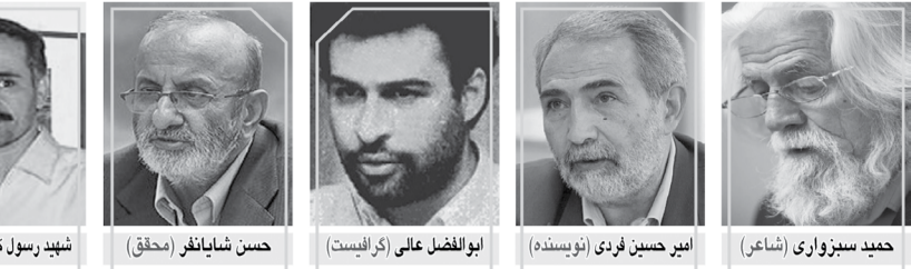
حمید سبزواری (شاعر)