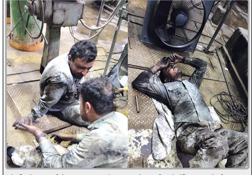
نشدنی کندانسور نیروگاه رامین که می‌توانست به خاموشی در بخشی از کشور در اوج گرمای کنونی ختم شود، توسط متخصصان داخلی طی کمتر از ۱۸ ساعت در حالت آماده نیروگاه تعمیر شد.