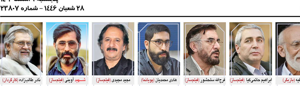
نادر طالبیان‌زاده (کارگردان)

صفحه ۸ پنجشنبه ۹ اسفند ۱۴۰۳ ۲۸ شعبان ۱۴۴۶ – شماره ۲۳۸۰۷