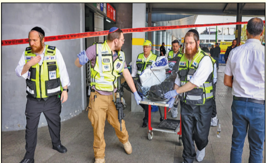
عملیات استنهدادی در حیفا ۵ شهپونیست کشته و زخمی شدند

پسر نخست‌ست‌وزیر رژیم صهیونیستی می‌گوید اگر در آن شبی که عملیات طوفان الاقصی انجام شد، پدرش را از خواب بیدار می‌کردند، این همه صهیونیست به هلاکت نرسیده بود.