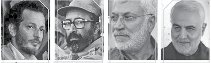
شهید قاسم سلیمانی