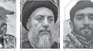
شیخ زکزاکی در یک مراسم