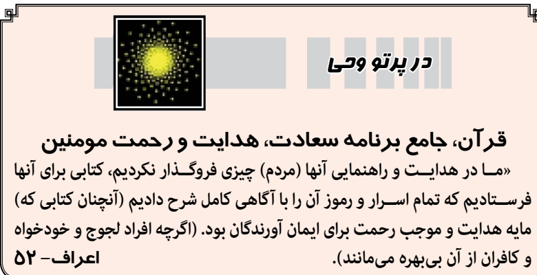
در پرتو وحی