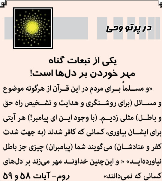
در پرتو وحی