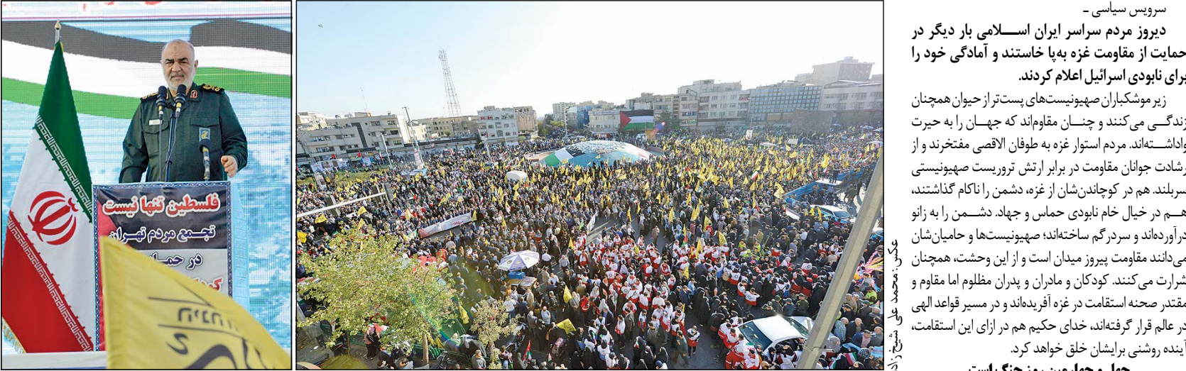
سرویس سیاسی -

دیروز مردم سراسر ایران اسلامی بار دیگر در