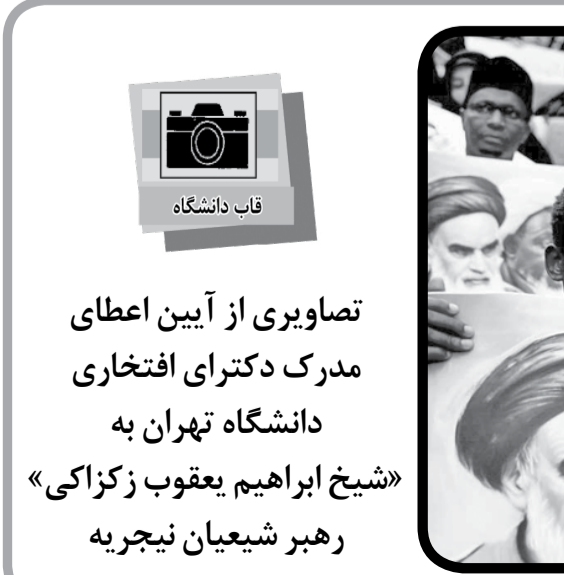
تصاویری از آیین اعطای مدرک دکتری افتخاری «شیخ ابراهیم یعقوب زکزاکی» رهبر شیعیان نیجریه

امروزه با استفاده از تکنولوژی‌های ارتباطاتی مانند سایت‌ها، وبلاگ‌ها و... ایسن تأثیرگذاری از سوی آنها راحت‌تر اعمال می‌شود. شیوه عمده