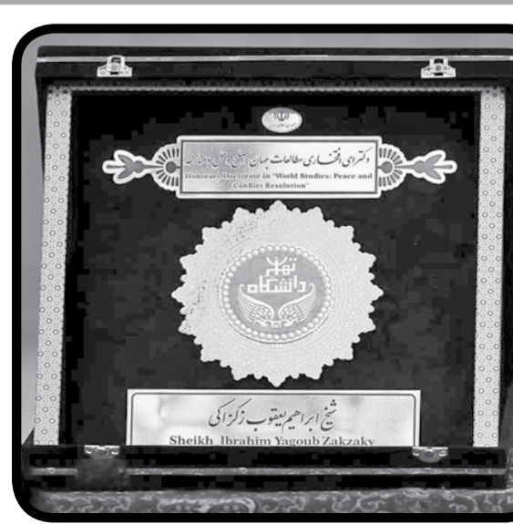
تصاویری از آیین اعطای مدرک دکتری افتخاری «شیخ ابراهیم یعقوب زکزاکی» رهبر شیعیان نیجریه