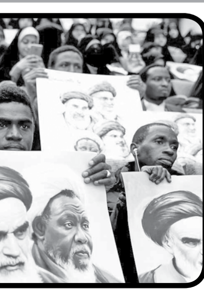
تصاویری از آیین اعطای مدرک دکتری افتخاری «شیخ ابراهیم یعقوب زکزاکی» رهبر شیعیان نیجریه