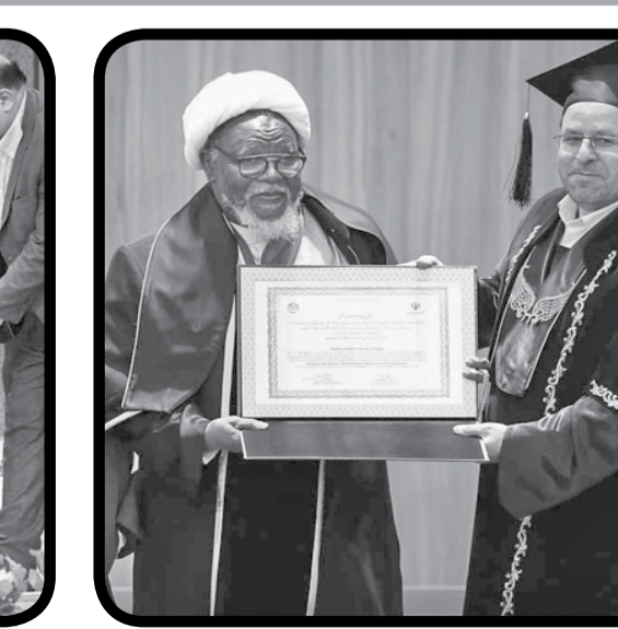
تصاویری از آیین اعطای مدرک دکتری افتخاری «شیخ ابراهیم یعقوب زکزاکی» رهبر شیعیان نیجریه