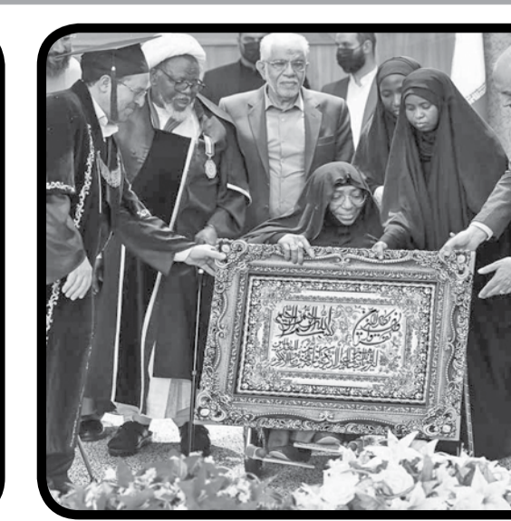
تصاویری از آیین اعطای مدرک دکتری افتخاری «شیخ ابراهیم یعقوب زکزاکی» رهبر شیعیان نیجریه