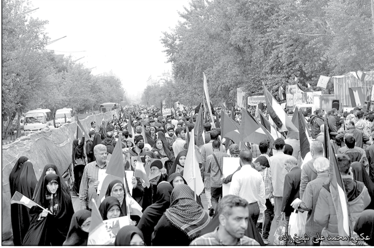
شعار «موتور فلسطین» در تهران