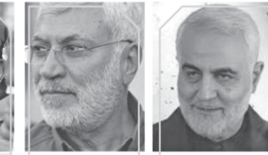
شهید قاسم سلیمانی