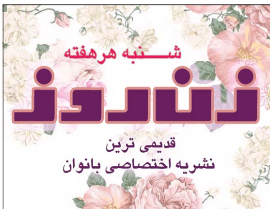
شنبه هر هفته

ای شرقی همیشه که شعرم برای توست در بیست بیت هر غزلم در پای توست احساس می‌کنم که کمی دوست دارم تنها دلیل منطقی‌ام چشم‌های توست گویا مرا به نام حقیقی صدا زدی باور کنم- پرند من- این صدای توست؟ حال و هوای چشم تو شعر مرا سرود شعرم همیشه حاصل حال و هوای توست همواره انتهای غزل خوب می‌شود وقتی که انتهای غزل ابتدای توست در ابتدای چشم تو شعری شوق شد شعری که بیت‌های قشنگش برای توست هادی خوش‌شایان