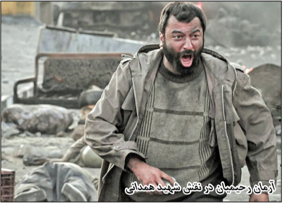
آرمان رحیمیان در نقش شهید همدانی

فیلم «احمد» هم یکی از آثار چهل و دومین جشنواره فیلم فجر است که دربار‌ه موضوع و شخصیت‌های واقعی ساخته شده‌است. برخلاف خیلی تصورات، سومین فیلم امیرعباس ربیعی بعد از «الیاس خصمی» و «شد» یک فیلم دفاع مقدسی نیست، بلکه این فیلم درباره زلزله بم ساخته شده و ساعات ابتدائی این حادثه خوفناک تاریخ معاصر ایران را روایت می‌کند. اما یکی از نقاط عطف فیلم «حمد» به تصویر کشیدن حضور سردار شهید احمد کاظمی، به عنوان یکی از منجیان مردم زلزله‌زده است. شهید کاظمی یکی از فرماندهان ارشد سپاه پاسداران انقلاب اسلامی بود که همراه با حاج قاسم سلیمانی در همان نخستین ساعات رخ دادن زلزله‌سم، خود را به آنجا رساندندند و نقش مؤثر و حیاتبخشی داشتند. حالا با ساخت فیلم «احمد» بخشی از تلاش‌های شهید احمد کاظمی در سینما ثبت شده‌است. بازیگر نقش این سردار شهید در فیلم احمد، «تینو صالحی» است؛ یکی از هنرمندان تئاتر که قبلا هم در چند فیلم، در نقش‌های فرعی حضور داشته، اما این بار در نقش یکی از قهرمانان ملی کشورمان مقابل دوربین رفته‌است.