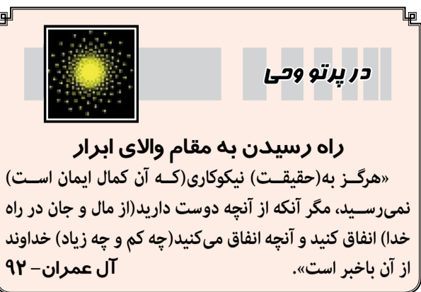
در پرتو وحی