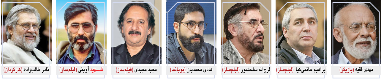
نادر طالب‌زاده (کارگردان)

یادآوری این نکات برای این بود که مهران مدیری نه تنها با وجود اعلام جنگ با رسانه ملی، ۲۰ میلیارد تومان از این دستگاه دریافت کرده که همان روزها سینما و هنرمین مدیوم هنری و تصویری در عصر حاضر، ظرفیتی فوق‌العاده برای بازگو کردن موضوعات مختلف را در درون خود دارد. پیوند آشکار سینما با حوزه ادبیات منجر به بیان روایات گوناگون و متعدد از طریق زبان سینما و داستانهایی با بار دراماتیک شده است. شکی نشک فیلمسازان ایرانی مختلف فیلم از منظر مطالعات سینمایی، بستر مناسبی را برای هنر هفتم مهیا می‌کند تا این بازگوسازی، جامع و در چهار چوبی مشخص صورت پذیرد. با به‌وجود آمدن عصر ارتباطات و پیشرفت وسایل ارتباط‌جمعی اما، جشنواره‌های فیلم تبدیل به محلی برای برون‌ریزی مضامین بیان شده از طریق سینما شدند.فیلم‌های سینمایی مختلف که حرف‌های جدیدی برای مخاطبان