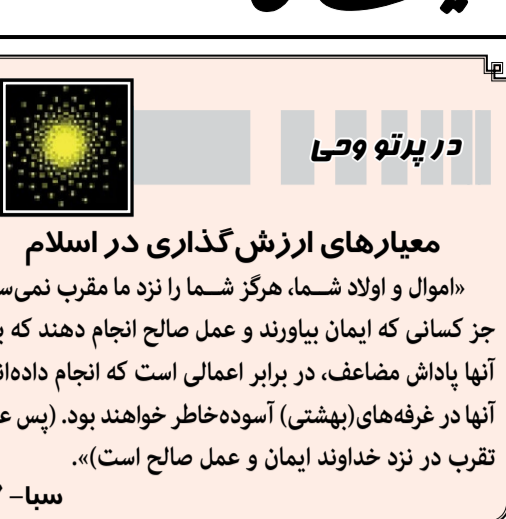
در پرتو وحی