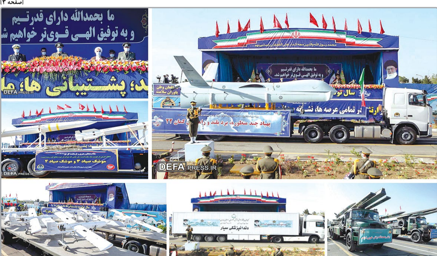
رژه پهپادها، موشک‌ها و تجهیزات ارتش با شعار «مدافعان وطن، یاوران سلامت»