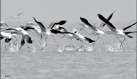
اردبیل – خبرنگار کمیهان:

گونه‌های مختلف از پرندگان مهاجر در مسیر مهاجرت در تالاب‌ها و آب‌بند های پارس‌آباد مغان فرود آمده‌اند.