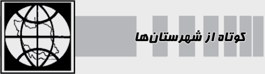
کوتاه از شهرستان‌ها