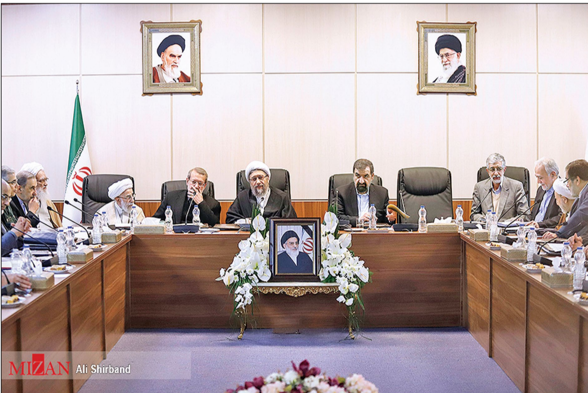
مجمع تشخیص اصلاحیه قانون داخلی مقابله با پولشویی را تصویب کرد

۲۴ اردیبهشت ۹۷ قرار بر این شد که ظرف یک ماه اتحادیه اروپا بسته راهکارهای عملی خود در رابطه با خواسته‌های ایران را نقد نماید.