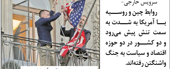
روس‌ها کنسولگری آمریکا