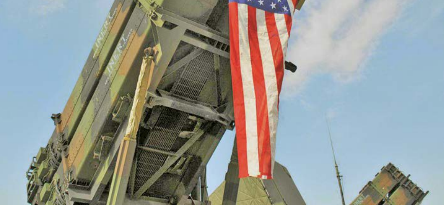
فروش این سامانه‌ها سر آل‌سعود کلاه گذاشته است.

به دنبال ناگامی‌های بی‌درسی و مفتضحانه سامانه‌های ضد موشک عربستان در برابر موشک‌های انصارالله یمن، فارین پلیسی طی گزارشی نوشت، آمریکا به ریاض، سامانه‌های موشکی «پنجل» فروخته است چرا که ریاض تاکنون نتوانسته حتی یک موشک انصارالله را رهگیری کند.