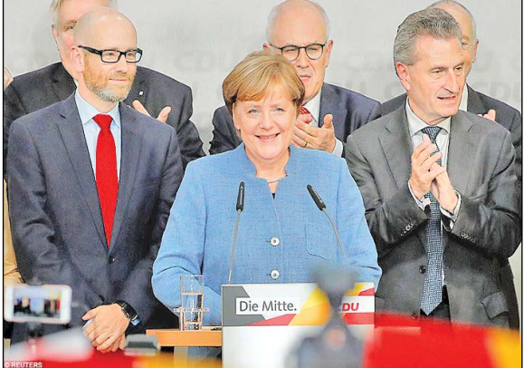
سرویس خارجی –

اتکلا مرکل صدراعظم آلمان با پیروزی شکنده در انتخابات پارلمانی روز یکشنبه تلخ‌ترین پیروزی را در دوران فرمانداری خود تجربه کرد که برای چهارمین بار صدراعظم آلمان باقی ماند.