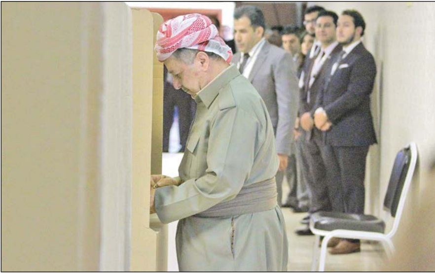
سرویس خارجی –

همزمان با برگزاری همه‌پرسی جدایی در منطقه خودمختار کردستان عراق و شش استان همجوار آن، صهیونیست‌ها و سران رژیم اسرائیل، شادمانی و از این اتفاق، استقبال کردند. رژیم صهیونیستی اعلام کرده اولین رژیمی خواهد بود که این همه‌پرسی را به رسمیت خواهد شناخت چراکه برای آن برنامه‌ها دارد.