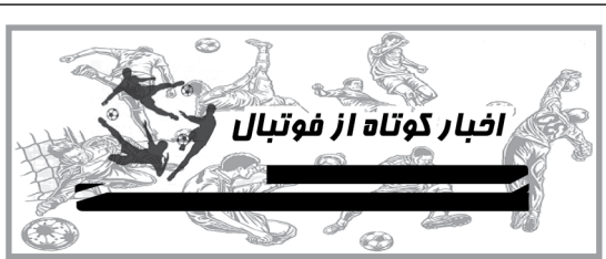
اخبار کوتاه از فوتبالیان

خیال تراکتوری‌ها از حضور در آسیا راحت شد