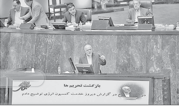
وزارت اقتصاد در گزارش گزارش خدمت کمیسیون انرژی توضیح دادم

وی خطاب به علی مطهری نایب رئیس مجلس اظهار داشت: آقای مطهری، من خواهش می‌کنم به این رفتار پولیویستی که برخی دارند و طی آن به جریانات سیاسی و روحانیت توهین می‌کنند رسیدگی کنید.