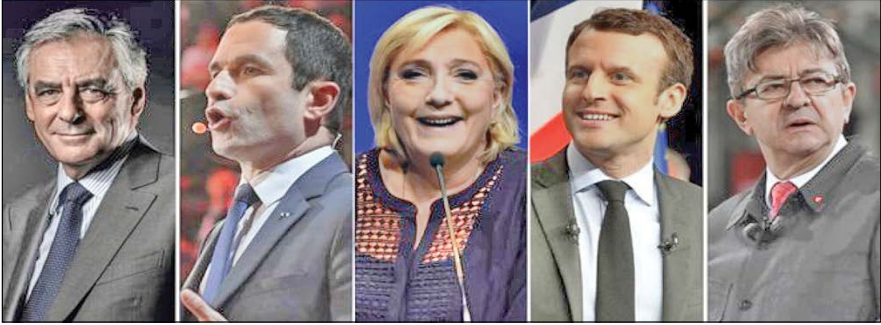
سرویس خارجی -

انتخابات ریاست جمهوری فرانسه تحت شدیدترین تدابیر امنیتی امروز در حالی برگزار می‌شود که به دنبال حادثه تروریستی پنج‌شنبه گذشته نظرسنجی‌ها از افزایش بخت و اقبال نامزد حزب راست یعنی «ماری لوین» حکایت دارد. «لوین به دنبال خروج از اتحادیه اروپاست.»