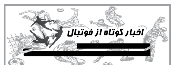
خونه به خونه نخستین فینالیست مازنی جام حذفی

خونه به خونه بابل با شکست سه بر یک استقلال خوزستان در وقت‌های اضافه، به فینال جام حذفی صعود کرد و حریف استقلال تهران شد.