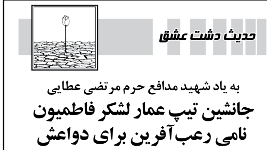
حدیث دشت عشاق

صفحه ۹ شنبه ۱۹ اسفند ۱۳۹۶ ۲۱ جمادی‌الثانی ۱۴۳۹ - شماره ۲۱۸۶۳