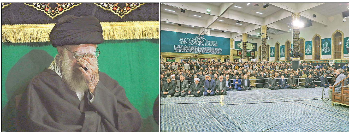
دومین شب مراسم عزاداری حضرت فاطمه زهرا (سلام‌الله‌علیها) در حضور رهبر انقلاب برگزار شد. فاطمه زهرا (سلام‌الله‌علیها) با حضور رهبر معظم انقلاب اسلامی، جمعی از مسئولان و قشرهای مختلف مردم در حسینیه امام خمینی (رحمة الله علیه) برگزار شد.