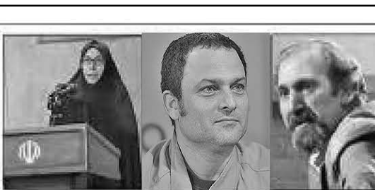
پروانه معصومی (بازیگر)