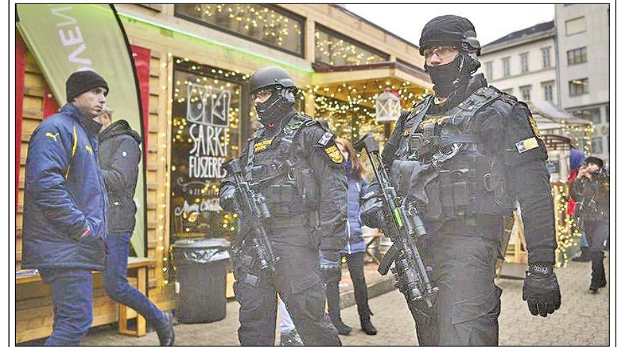
* مقام اروپایی با ابراز «نگرانی شدید» از بازگشت تروریست‌ها از سوریه و عراق به اروپا، آنان را به مثابه «بمب‌های ساعتی» در داخل جوامع اروپایی برشمردند. * طی ماه‌های گذشته ده‌ها عملیات تروریستی با صدها کشته و زخمی در سراسر اروپا اتفاق افتاده و هزاران نفر نیز توسط پلیس به اتهام عضویت در گروه‌های تروریستی دستگیر یا احضار شده‌اند. صفحه آخر

هشدار اروپا درباره بازگشت تروریست‌ها به غرب بمب‌های ساعتی متحرک از عراق و سوریه راهی اروپا شده‌اند