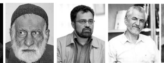
نصرالله مردانی (شاعر)