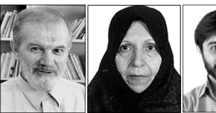
ال احمد (نویسنده)

توجه ویژه امام خاتمه‌ای به مداحی اهل بیت(ع)