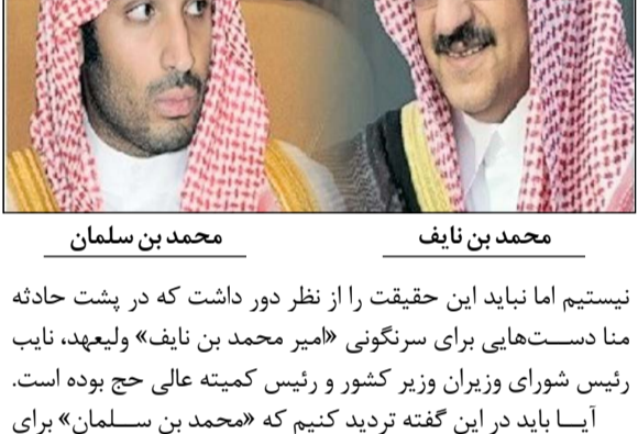
محمد بن نایف

همزمان با این گزارش، تصاویر ویدئویی عبور کاروان محمد بن سلمان از میان حجاج و بسته شدن مسیر و… منتشر شد. روزنامه انگلیسی میدل ایست نیز با انتشار گزارشی مشابه، فاجعه منا را نتیجه جنگ قدرت بین شاهزادگان سعودی دانست. بسیاری از تحلیلگران معتقدند وقوع چنین جنایتایی از سوی محمد بن سلمان دور از انتظار نیست چرا که این شاهزاده سعودی در یمن نیز مرتکب جنایات بی‌شماری شده است.