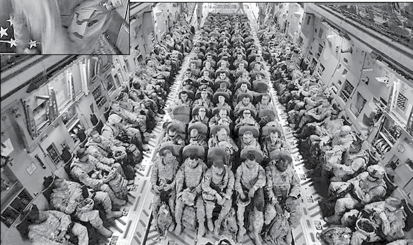
سربازان آمریکایی در یک کانتینر در یک کشتی در راه به سوی عراق

« سعی کرد تصویر خانه کوچکشان را در میامی به یاد بیاورد اما جز چند تصویر مهم و ناراحت‌کننده، چیزی به خاطرش نیامد. دلش نمی‌خواست به این مأمورت بیاید، به خصوص حالا که داشت پسردار می‌شد، شانه بالا انداخت و اندیشید: «ارتش است؛ باید اصلاً ارتش برای چه آدم می‌خواهد؟ برای این که او را بگذارد دیگر توپ، هر وقت هم که گلوله توپ تمام شد خود آدم را بگذارد دم توپ.»