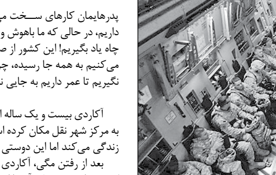
سربازان آمریکایی در یک کانتینر در یک کشتی در راه به سوی عراق