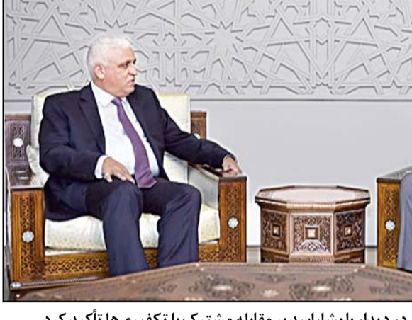
نماینده ویژه نخست‌وزیر عراق در دیدار با بشار اسد بر مقابله مشترک با تکفیری‌ها تاکید کرد.

به گزارش فارس، تکفیری‌های داعش ۲۸ کارمند کمیسوی عالی انتخابات عراق را در موصل اعدام کردند. جرم این افسران از نگاه داعش این‌ بود که آنها در روند انتخابات حضور داشتند!