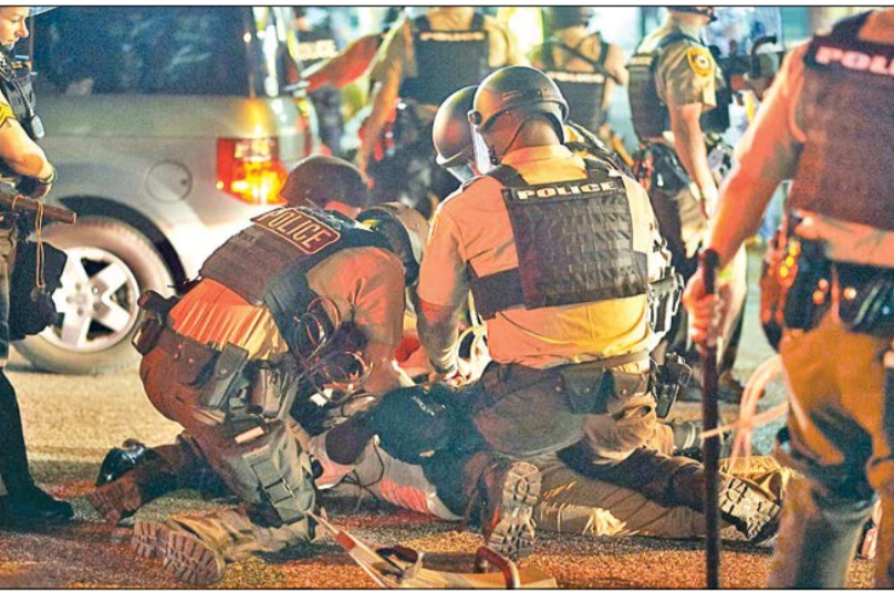
یک سال پس از قتل وحشیانه مایکل براون، نوجوان سیاهپوست آمریکایی به دست پلیس نژادپرست آمریکا شهرهای مختلف این کشور شاهد تجمعات گسترده ضد آمریکایی شد. صفحه آخر

اعلام وضعیت اضطراری در فرگوسن پلیس آمریکا در سالگرد قتل مایکل براون تظاهرات ضدنژادپرستی را سرکوب کرد