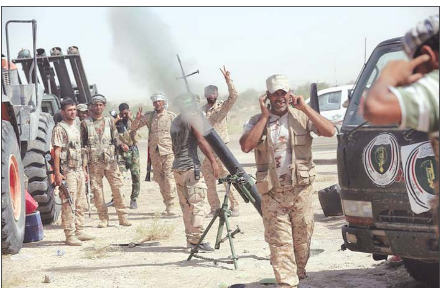
پیشروی‌های ارتش عراق و سوریه تکفیری‌ها را به جان هم انداخته است

دستورات داعشی اعلام شده است! از سوریه نیز خبر می‌رسد، سران داعش ۹ نفر از اعضای عقبنشینی از مواضع خود در این استان، با شلاق یا بریدن سر مجازات می‌شوند! این اظهارات سران داعش نشان می‌دهد که عناصر این گروه روحیه خود را از دست داده‌اند. پیشروی کتونی نیروهای دولتی در استان الانبار هم روحیه رهبان و عناصر تکفیری را به شدت تضعیف کرده است.