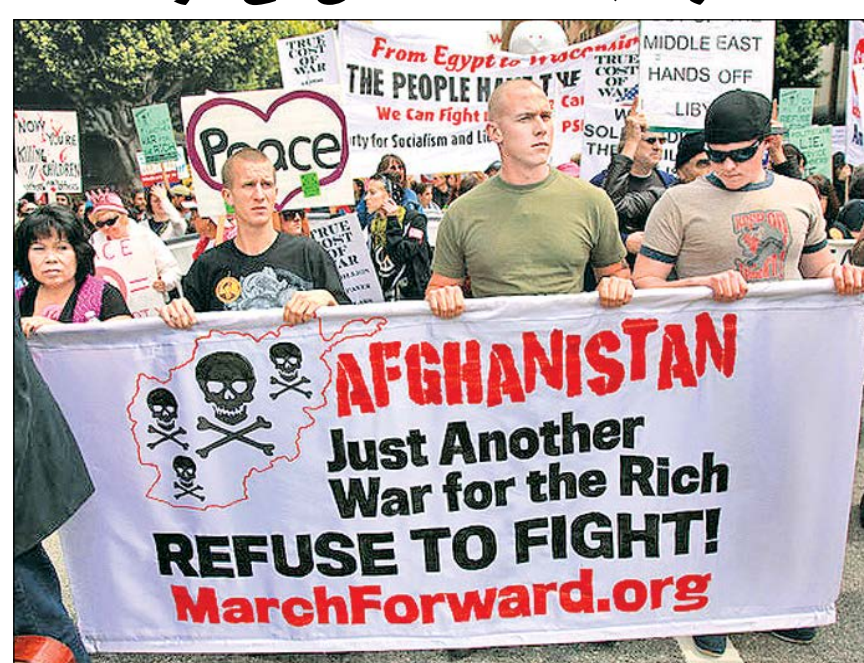
مخالفات‌های گسترده مردم آمریکا با جنگ افغانستان نیز مانع از جنگ‌افروزی‌های کاخ سفید نشده است.

براساس آخرین بررسی‌های انجام شده، هر ساعت چهار میلیون دلار از پول مالیات شهروندان آمریکایی برای جنگ در افغانستان هزینه می‌شود.