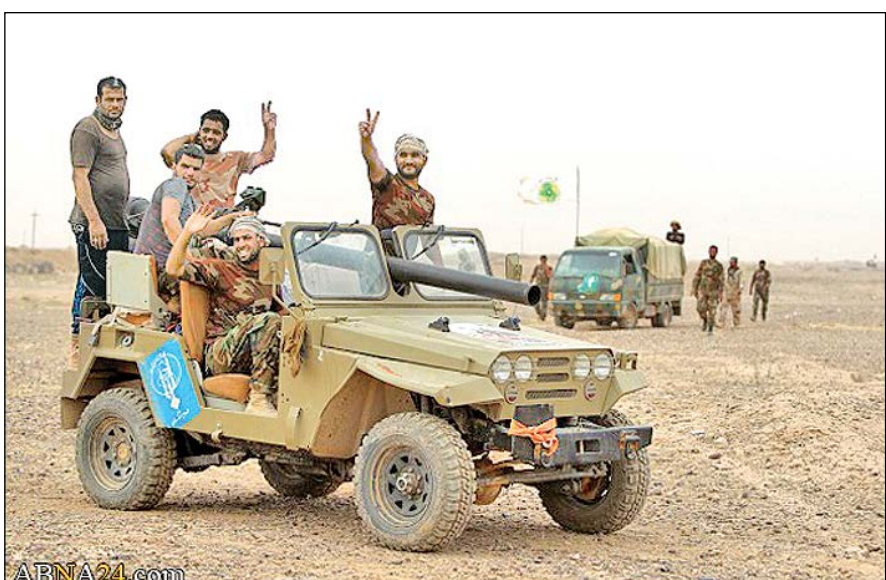
پیشروی‌های ارتش عراق و سوریه تکفیری‌ها را به جان هم انداخته است