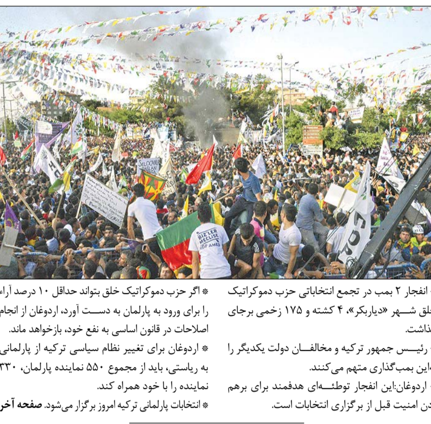
انفجارهای خونین در تجمع کردهای مخالف اردوغان

* وال استریت ژورنال: رهبر عالی ایران در سالگرد بنیانگذار جمهوری اسلامی بار دیگر تاکید کرد که آمریکا و دیگر قدرت‌های مستکبر قابل اعتماد نیستند. * سسی‌بی‌اس نیوز: آیت‌الله خامنه‌ای که تاکنون بارها از تیم مذاکره‌کننده هسته‌ای حمایت کرده است در سخنان خود بر بی‌اعتمادی به غرب به ویژه آمریکا تاکید کردند. * خبرگزاری فرانسه: آیت‌الله خامنه‌ای نسبت به برقراری هرگونه رابطه با آمریکا، یکی از چند قدرت جهانی در حال مذاکرات هسته‌ای با ایران، هشدار داد. * رهبر انقلاب با تاکید بر بی‌اعتمادی به غرب شیطان بزرگ بودن آمریکا را از اصول ماندگار بنیانگذار جمهوری اسلامی خواند. * المنار: آیت‌الله خامنه‌ای در سخنان خود بر پایداری مردم ایران به اصول و مبنای امام خمینی تاکید و افزودند آمریکا کماکان «شیطان بزرگ» محسوب می‌شود. * آرتوتز ششوا از رسانه‌های رژیم صهیونیستی: آیت‌الله خامنه‌ای پلیس آمریکا را شیبه تروریست‌های داعش دانست. * شین‌ها: آیت‌الله خامنه‌ای رهبر عالی‌رتبه ایران مخالفت خود را با حملات هوایی ائتلاف عربستان علیه یمن اعلام کرد. صفحه ۳