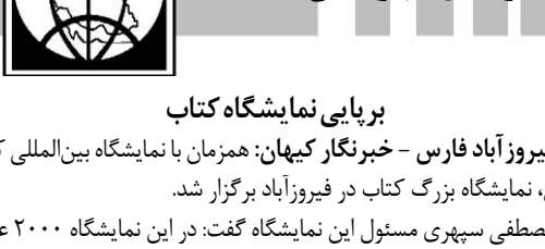
کوتاه از شهرستان ها