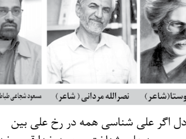
نصرالله مردانی (شاعر)