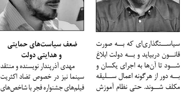
ضعف سیاست‌های حمایتی و هادنیاتی دولت