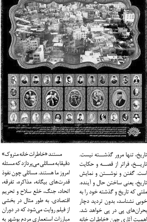
مستند «خاطرات خانه متروک»

تاریخ، تنها مرور گذشته نیست. تاریخ، فراتر از قصه و حکایت است. گفتن و نوشتن و نمایش تاریخ، یعنی ساختن حال و آینده. ملتی که تاریخ و گذشته خود را به خوبی نشناسد، بدون تردید دچار بحران‌های پی در پی خواهد شد. اهمیت آثاری چون «خاطرات خانه متروک» هم به خاطر این است که گوشه‌هایی از تاریخ را ترسیم می‌کند که امروز نیز امکان وقوع دوباره آن‌ها هست.