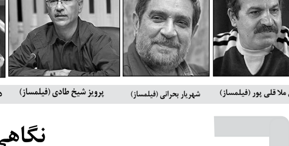
شهریار بحرانی (فیلساز)

اسامع هم برای نخستین بار هشت انیمیشن سینمایی فاخر و سطح بالا به جشنواره بالا رفتن فرصت نمایش دادند. از آن جمله فیلم «موجانگ» که در جشنواره فیلم فجر در سال ۸۲ با محور قرار دادن شخصیتی دلآور و ملهم از سردار قاسم سلیمانی، در قابی چشم‌نواز و خیره‌کننده، داستانی درباره غلبه ایران بر دشمنانش در یک جنگ درباری را نمایش می‌دهد. «در مسیر باران» هم یک انیمیشن خوش‌ساخت و با مضمونی دینی است که هم کارگردانی حامد کاتبی، جایزه بهترین کارگردانی انیمیشن جشنواره را دریافت کرد. «تلمور»، «ایه‌های بی‌قراری»، «هزائم‌مانده» و «قلب خورشید» هم دیگر انیمیشن‌های قابل توجهی در بین طیف‌های سینمای ایران بودند.با وجود این آثار، اما متأسفانه انیمیشن نمایش این انیمیشن‌ها بسیار محدود بود. به جز «فهرست مقدس» یکی از هفت اثر، امکان دیده شدن در کاخ جشنواره را نیافتند. در سایر سینماها نیز فرصت نمایش آن‌ها چندان قابل توجه نبود. این درحالی است که سایر بخش‌ها، ازجمله مستند و هنر تجربه، به رغم کمبود مخاطب، هر روز در کاخ جشنواره یک نوبت نمایش داشتند. این یک تبعیض بود که البته به ضرر خود جشنواره تمام شد.امید است که در دوره‌های آینده جشنواره فجر، هر طوری برنامه‌ریزی شود که این بخش هم از فرهنگ کشورمان نیز امکان خودنمایی بیشتر در این جشنواره را پیدا کند.