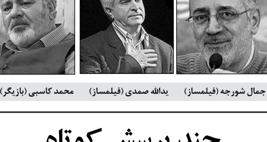
جمال شورجه (فیلمساز)