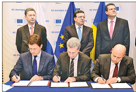
سرانجام روسیه، اوکراین و کمیسیون اروپا طرح زمستانی فروش گاز را امضا کردند.

پس از ماه‌ها اختلاف و کشمکش سرانجام نمایندگان روسیه، اوکراین و کمیسیون اروپا روز پنجشنبه سندی در خصوص طرح زمستانی فروش گاز امضا کردند که از سرگیری ارسال گاز طبیعی روسیه به اوکراین و تأمین ترانزیت آن به کشورهای اروپایی در فصل زمستان را موردنظر قرار داده است.