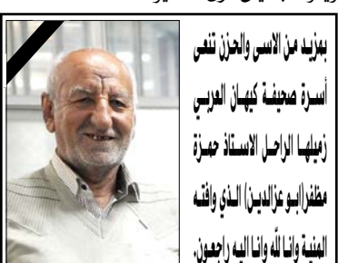
بدينا من الأسس والجزء نفس أسرة صبغفا نيهال الروسي زانيليا الراجل الأستاذ حمزة مظفر البوعز الجبل والدي والته العنية والناله وانما اليه لاجلهم.

وأشار شجاعى الى تنفيذ اتفاقية إلغاء تأشيرات السفر الجماعية لمواطني إيران وروسيا: في هذا الإطار، يتم استقبال السياح في مجموعات تتراوح بين ٥ و ٥٠ شخصاً من كلا البلدين لمدة ١٥ يوماً. وتابع: تتمتع روسيا وإيران بثقافة وتاريخ غنيين ومعالم طبيعية توفر الظروف الملائمة للتبادل السياحي، لذلك