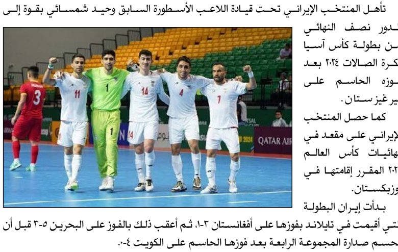
الدور نصف النهائي من بطولة كأس آسيا لكرة الصالات ٢٠٢٤ بعد فوزه الحاسم على قيرغيزستان.

فازت منتخب إيران على منتخب قيرغيزستان بنتيجة ١-٦ في ربع نهائي آسيا لكرة الصالات. وأفادت وكالة مهر للأخبار، انه فاز المنتخب الإيراني لكرة الصالات للرجال على منتخب قيرغيزستان بنتيجة ١-٦ في الدور ربع النهائي لكأس آسيا لكرة الصالات ٢٠٢٤ التي تقام اليوم الأربعاء في تايلاند.