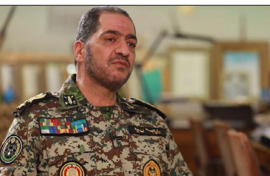
بمنصب النائب الجديد لخطة وبرنامج وميزانية الدفاع الجوي.

ومجتهدين في المناصب الحساسة والتشغيلية والاستراتيجية لقوة الدفاع يلعب بالتأكيد دوراً مهماً وأساسياً في زيادة قدرات هذه القوة.