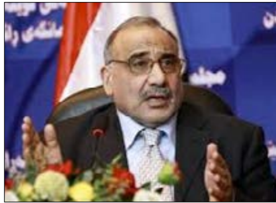
«الغدیر نسخة منه انه ان «العراقيين قادرين على ايجاد الحلول لجميع الازمات وبناء مستقبل افضل، ونحن متفائلون بتحقيق ذلك». ودعا

بغداد - وكالات: أكد رئيس مجلس الوزراء عادل عبد المهدي، أمس الاثنين، أن العراقيين قادرين على ايجاد حلول لجميع الازمات وبناء مستقبل أفضل، وقال في كلمة القاها خلال حضوره امس منتدى المخترعين في يومهم السنوي الثالث، بحسب بيان لمكتبه تلقت