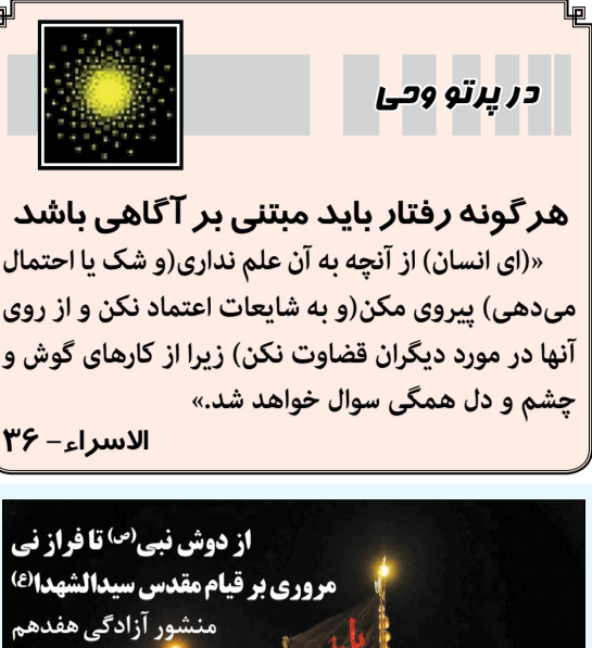
در پرتو وحی