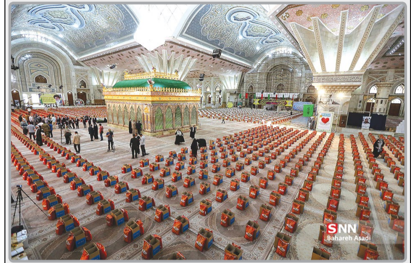
مرحله دوم رزمایش کمک مؤمنانه، عصر شنبه در حرم امام خمینی (ره) برگزار شد. در این مرحله از رزمایش در هر استان، ۲۵ هزار بسته مواد غذایی بین نیازمندان توزیع می‌شود.