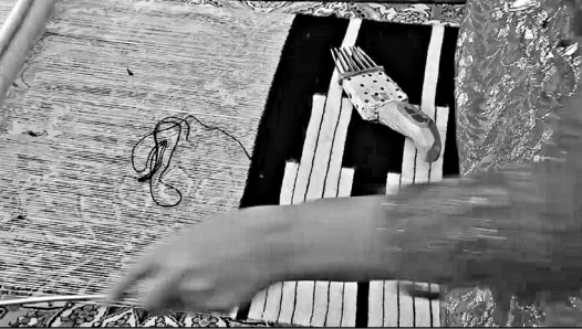
اهواز- خبرنگار کهپان: