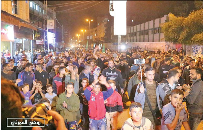
شادی مردم غزه