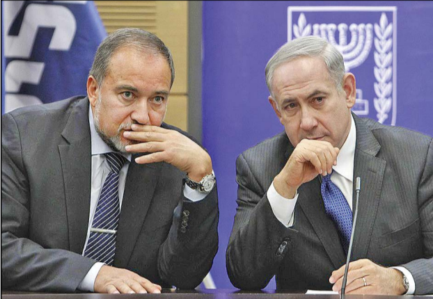
استعفای لیبرمن از کابینه نتانیاھو

فرد برای مقاومت، پس از شکست امنیتی و نظامی این رژیم در غزه بود.