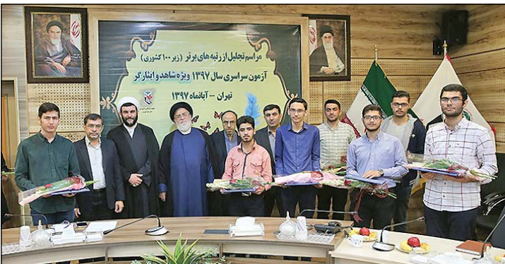
معاون فرهنگی و آموزشی بنیاد شهید و امور ایثارگران نیز در این مراسم گفت: ۴۶ هزار دانش‌آموز ایثارگر در سال ۱۳۹۷ تحت پوشش طرح حاضر شدند و در حال حاضر ۲۸۰۰ گروه‌های آموزشی حائز رتبه‌های برتر کشوری زیر نظر از ایثارگران عضو هیئت‌های علمی هستند و ۶۰ درصد دانش‌آموزان از ۲۰ درصد